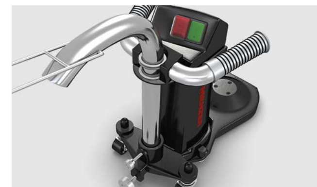
La poussière est immédiatement aspirée par le tuyau orientable.