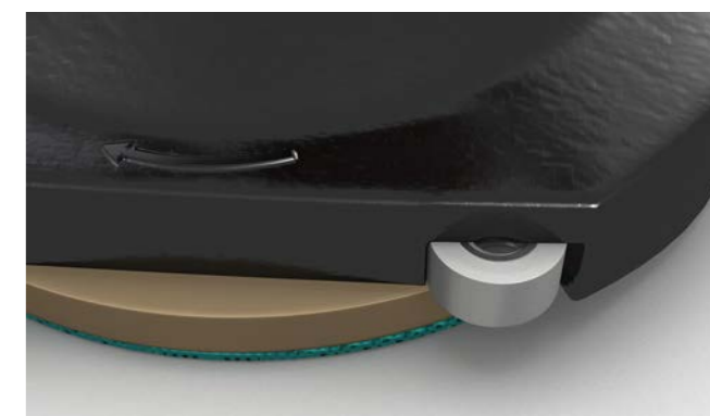
Deux roulettes murales offre une guidage régulier.